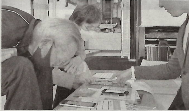
スマートフォンや生前整理アプリの使い方を教えてもらう参加者たち。いずれも泉南市の明覚寺

元気なうちに身の回りや財産の情報について記録しておく「生前整理アプリ」を開発した会社が12日、泉南市岡田5丁目の明覚寺で、高齢者向けのスマートフォン教室を開いた。